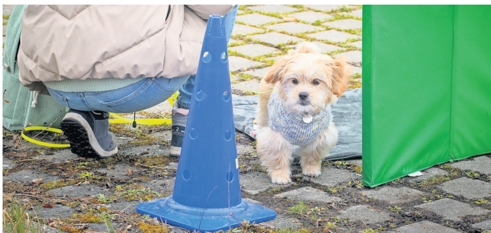
Buddy guckt vorsichtig hinter dem Sichtschutz hervor.